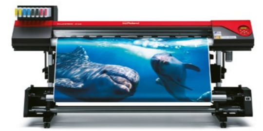
*Foto meramente ilustrativa com take-up opcional

*1 O suporte de material deste equipamento é projetado exclusivamente para material em rolo com tubo de papel medindo 3 polegadas. Para utilizar rolos de 2 polegadas, são necessárias as flanges para material de impressão opcional. *2 O comprimento da impressão está sujeita a limitações do programa. *3Tipo de material de impressão: Material de impressão especificado pela Roland DG Corp. Temperatura: 25°C (77°F), umidade: 50% O material em rolo deve ser carregado corretamente. Excluindo expansão/contração do material Não é garantido quando o aquecedor de impressão ou secador é utilizado. Todas as correções ou funções de ajuste deste equipamento foram feitas corretamente. Percurso de impressão: 1m *4 Espere aquecer depois de ligar na eletricidade. Isto pode demorar de 5 a 20 minutos, dependendo do ambiente de operação. Dependendo da temperatura ambiente e largura do material, a temperatura predefinida pode não ser atingida.