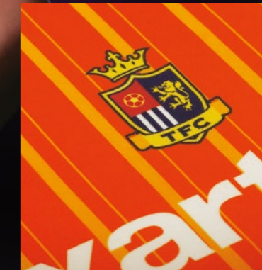
Excelente reprodução de cores

A tecnologia avançada de controle de impressão da XT-640, em combinação com a tinta Texart Ink, produz uma qualidade excepcional de impressão com nitidez e cores brilhantes. Para obter produção máxima a configuração de tinta de 4 cores oferece detalhes finos e contraste inigualável com velocidades de impressão impressionantes. Para ampliar a gama de cores a configuração de 8 cores inclui a tinta laranja e violeta fornecendo o máximo de impacto às impressões.