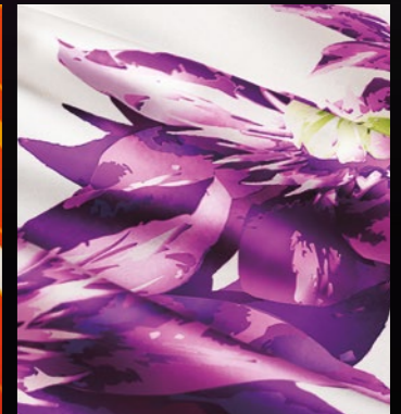
Gradações naturalmente suaves e detalhes finos