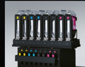
Sistema de tintas Roland

funções comuns da impressora. *iPad é uma marca comercial da Apple, Inc.