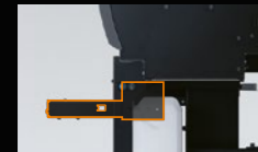
Ajustador de alimentação na parte dianteira

A XT-640 garante o tracionamento preciso do material para produção de alto volume. Um sistema avançado de vácuo mantém o papel de transferência reto para impressão, enquanto o novo Ajustador de Alimentação localizado na parte dianteira e traseira oferece uma tensão uniforme do material que impede o desalinhamento do material, resultando em um rolo precisamente enrolado na bobina de